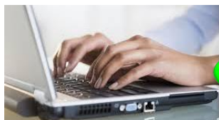
Doanh nghiệp xuất nhập khẩu