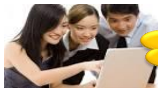
Hãng tàu, đại lý, forwarder