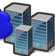
Hệ thống của Kho Bãi Cảng